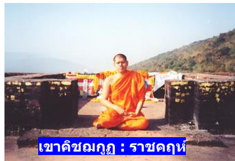
เขาคิชฌกูฏ : ราชคฤห์