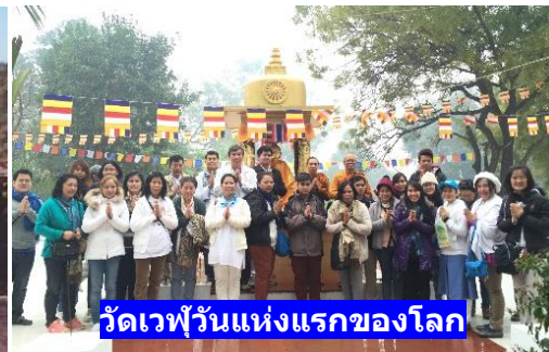
วัดเวฬุวันแห่งแรกของโลก